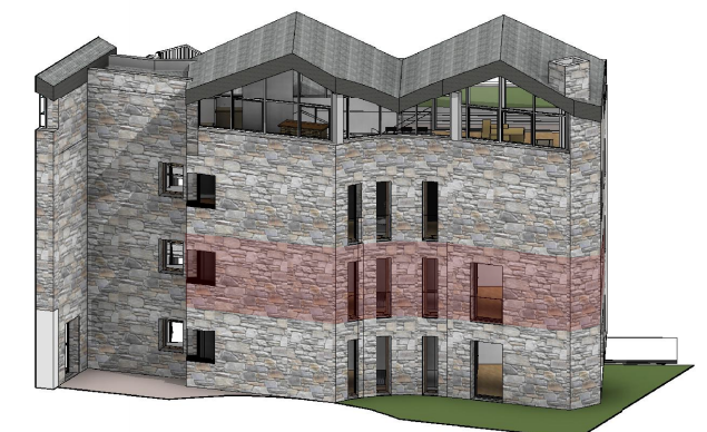
Part de Façana Posterior